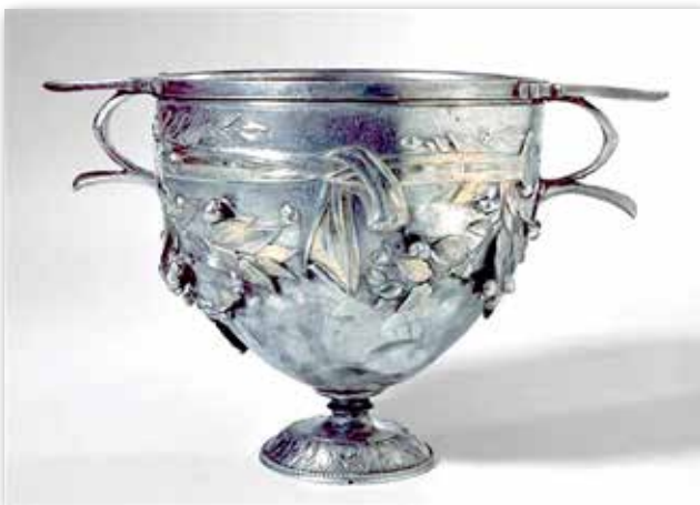
Canthare d'Alésia, Saint-Germain-en-Laye Musée d'Archéologie Nationale