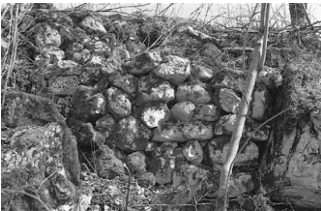
La "tortue" de la cote 801 et son étrange murage. (1975)

Nous pouvons témoigner qu'il y a çà et là des sortes de monuments, plutôt que de simples pierres dressées. Mais s'il est vrai que ce type de construction n'est pas attribuable à la fin de la période de la Tène, il est contestable d'affirmer péremptoirement que les Celtes ne vénéraient pas ces vestiges monumentaux, reliques d'un très lointain passé, et donc revêtus d'un halo de mystère divin ? Ne viendrait-elle pas de là, la légende d'une fondation par Héraklès, reprise à des fins de justification impérialiste par Denys d'Halicarnasse ?