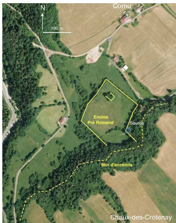
Vue satellitaire de 2006

L'enclos et son enceinte sont très visibles en vue aérienne ou satellitaire de même que la construction identifiée comme possible "temple des eaux".