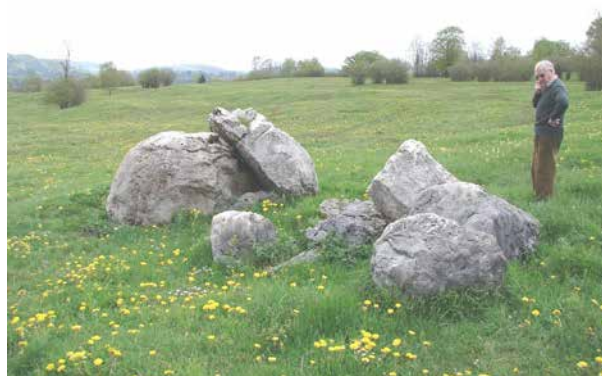
Ensemble de blocs rocheux à La Perrena : dolmen effondré ?

connaissances historiques. Par ailleurs, les collectivités territoriales n'ayant ni les moyens financiers, ni le potentiel humain pour conduire un tel travail de recherche, il est logique qu'ArchéoJuraSites propose de mettre à leur disposition les résultats de ses travaux ; par cette démarche, l'association ne se substitue pas aux communes mais elle devient leur partenaire. Les communes trouvent ainsi un juste retour des subventions qu'elles octroient à l'association et ArchéoJuraSites bénéficie d'une écoute et d'une reconnaissance susceptibles de favoriser l'avancée de ses travaux ; les élus peuvent notamment nous faciliter l'accès aux archives et plans cadastraux, jouer le rôle d'interface auprès des propriétaires, des agriculteurs des sylviculteurs afin de sensibiliser ceux-ci à nos préoccupations communes qui touchent plus particulièrement à la préservation des vestiges.