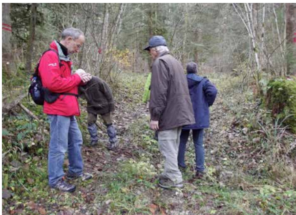
Balade d'observation sur le terrain

Ces similitudes concernent parfois la topographie des lieux (exemple : les petites combes quasi identiques situées dans le secteur compris entre Crans et La Perrena), parfois la structuration des vestiges, comme l'assemblage structure construite + tumulus dans le cas de sites à vocation culturelle ou encore comme l'association murs + fossés pour le cas de ce qui pourrait être interprété comme des systèmes militaires de retranchement gaulois ou romain ;