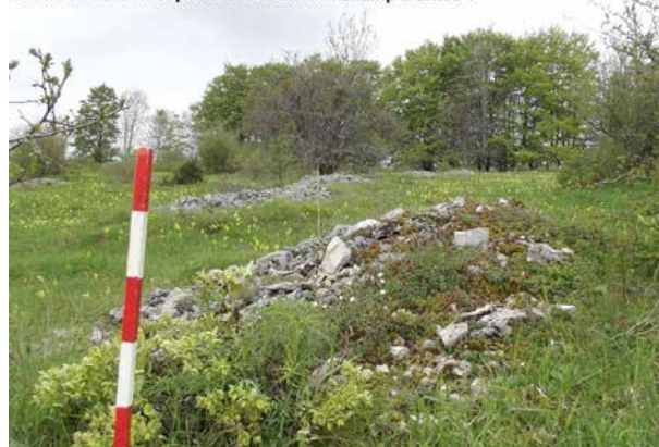
Ensemble de tumuli près de La Perrenna : champ d'urnes ?

Bien entendu, vous l'aurez compris en lisant les paragraphes précédents, l'association ne tient pas à conserver jalousement les résultats de ses recherches. Les partager sera le meilleur moyen de les faire reconnaître et de parvenir aux objectifs poursuivis. Des publications numérisées seront mises à disposition via le portail Internet, des articles seront diffusés dans le bulletin et des ouvrages consacrés spécifiquement à ces travaux pourront être rédigés. Il est bien entendu que certaines informations ne seront dévoilées que partiellement afin de ne pas attirer les détectoristes ou autres fouilleurs mal intentionnés.