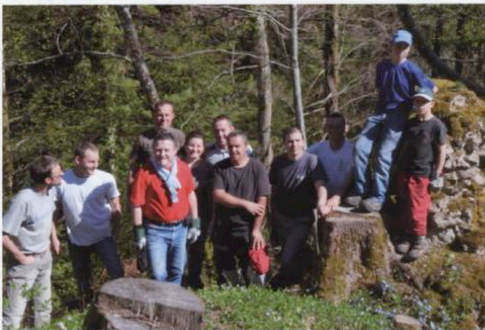
L'équipe "du château" sur le terrain