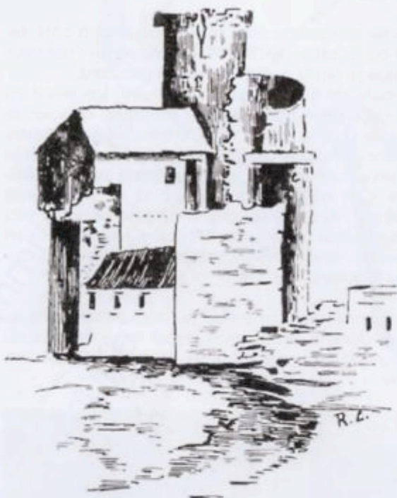
Fig. 6 - Les ruines du Château au XVII e siècle, d'après un Cadastre de 1791