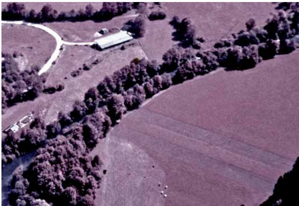
Traces de bandes parallèles très nettement révélées par la photo infrarouge de René Goguey

Beaucoup plus tard, le 4 juin 1991, Lamberts informe Berthier qu'il a finalement laissé reproduire des clichés commandés à René Goguey, alors que la mission de photographie aérienne est considérée comme non achevée. Sur la base de ces clichés, Lamberts suggère à nouveau que des fouilles soient faites dans la plaine de Syam notamment à l'endroit des bandes parallèles et du castellum (C-1991-02092).