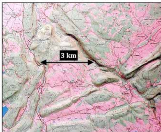
Deux cartes en relief à la même échelle permettant de comparer les deux sites

Pari gagné, donc ?... Eh bien, non, pas tout à fait encore, car il faudra patienter un an pour récupérer les cartes en relief (Chauv-des-Crotenay et Alise-Sainte-Reine) produites et conservées par l'IGN. Le 21 janvier 1997, Lamberts est prêt à craquer : "Malgré les pourparlers avec l'IGN, cette affaire ne tourne pas rond". En effet Paris ne livre pas, il faut s'adresser en Sologne où est située la Direction Commerciale, département Stock et Vente Directe (à Romorantin) mais