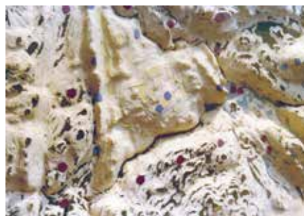
La maquette

réalisée par deux membres de l'équipe Edeine, par agrandissement photographique de la carte au 25/1000ème donnant ainsi une maquette à l'échelle de 8,333/1000ème.