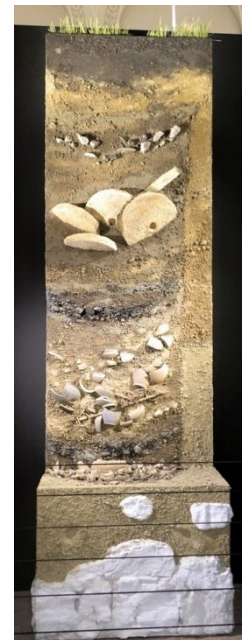
Coupe d'une fosse

Occupé à la fin du Second Âge du Fer (de 110 à 80 av. J.-C.), ce site atypique est sans équivalent en Europe celtique.