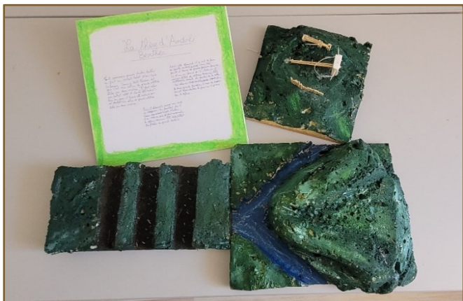
Le site vu par un élève de 3 e

Cette ouverture aux scolaires s'inscrit dans le cadre d'une démarche de l'association pour une sensibilisation des milieux scolaires à l'histoire locale.