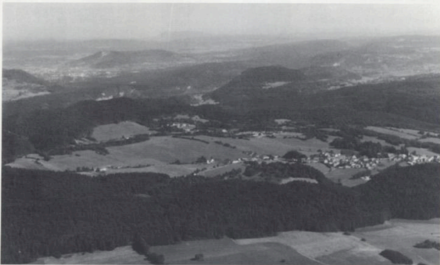
Vue générale de l'oppidum à partir du Sud